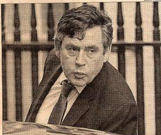
Gordon Brown es el ministro de economía británico, desde cuyo ministerio se ha promovido la reforma.

Entre las principales fortalezas del sistema anglosajón está el hecho de que las pérdidas económicas son rápidamente incluidas en los estados financieros publicados. El sistema sirve incentivar que los gerentes tomen acciones para mejorar las inversiones y las estrategias que hacen perder dinero, y así hacer a la compañía más eficiente. La amenaza de pleito por parte del accionista